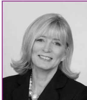
Emily O'Reilly Ombudsman