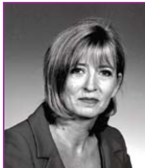
Emily O'Reilly Ombudsman