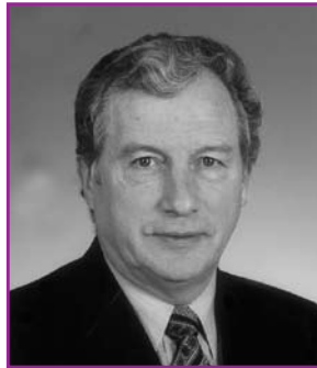
Michael Smith Iar-Theachta Dála